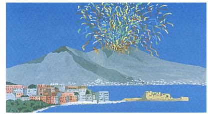
Vesuvius and Gulf of Naples, Italy

National Congress of the ITALIAN NEUROSCIENCE SOCIETY October 1-4, 2017 Lacco Ameno, Ischia Island - Naples, Italy