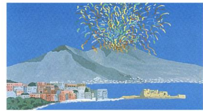
Vesuvius and Gulf of Naples, Italy

National Congress of the ITALIAN NEUROSCIENCE SOCIETY October 1-4, 2017 Lacco Ameno, Ischia Island - Naples, Italy