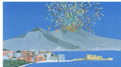
Vesuvius and Gulf of Naples, Italy

National Congress of the ITALIAN NEUROSCIENCE SOCIETY October 1-4, 2017 Lacco Ameno, Ischia Island - Naples, Italy