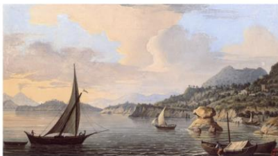
Lacco Ameno, Ischia Island - Naples, Italy