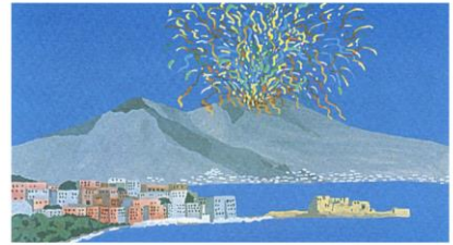
Vesuvius and Gulf of Naples, Italy

National Congress of the ITALIAN NEUROSCIENCE SOCIETY October 1-4, 2017 Lacco Ameno, Ischia Island - Naples, Italy