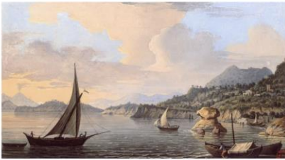
Lacco Ameno, Ischia Island - Naples, Italy