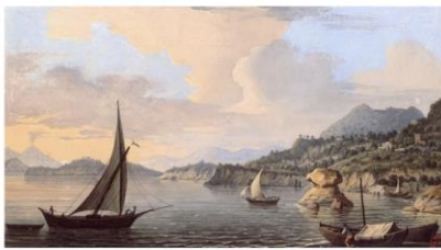
Lacco Ameno, Ischia Island - Naples, Italy